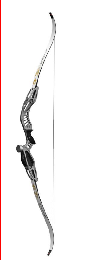
Barebow ou arc nu