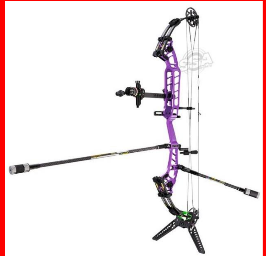
Arc à poulie ou compound