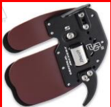
Palette / protection des doigts